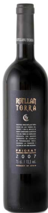
Rotllan Torra Criança: 90 punts Parker