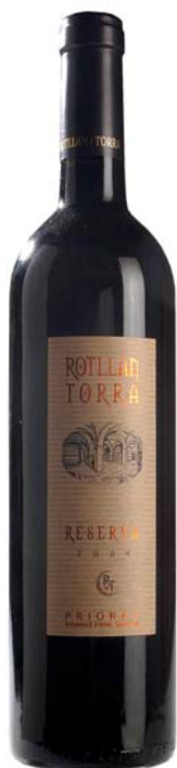
Rotllan Torra Reserva: 90 punts Parker

En quant l' Autor Reserva , és el primer any que el presentem i ha tingut una magnífica puntuació de 88 punts , i també es consolida dins dels grans vins low-cost.