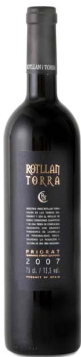
Rotllan Torra Crianza: 90 puntos Parker